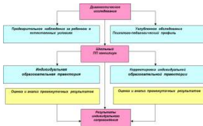
Рисунок 2. Схема взаимодействия педагогов и специалистов

Особое место в модели взаимодействия педагогов и специалистов общеобразовательного учреждения как заказчики образовательных услуг занимают родители (законные представители) учащихся с НОДА в решении вопросов их развития, социализации, здоровьесбережения, социальной адаптации. Программа взаимодействия педагогов и специалистов реализуется через работу школьного психолого-педагогического консилиума (ППК). Программа предполагает осуществление комплексного многоаспектного анализа эмоционально-волевой, личностной, коммуникативной, двигательной и познавательной сфер учащихся с НОДА с целью определения имеющихся проблем, разработки и реализации образовательной траектории, представленной на рисунке 2